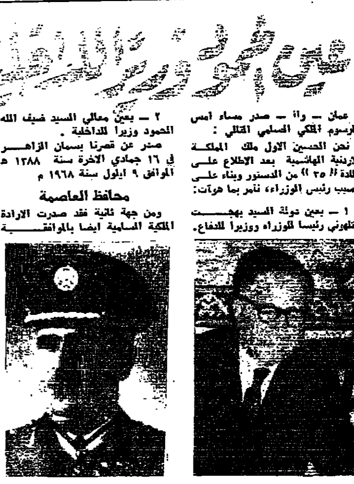
حكت مهياب / شيف الله الحبور

بين الموزع والاعطية وزيراً للداخلية عمان - ١١ - صدر مساء امس الرسوم التي الصلبي القتلي : نحن الحسين الاول ملك المملكة الزينية الهاشمية بعد الاجلاء على الملة (٢٥) من الدستور وبناء على نصيب رئيس الوزراء، ناصر بما هرت : ١ - بين دولة السيد بهجت القهوني رئيسا للوزراء ووزيراً للداخلية .